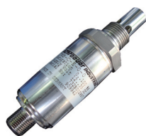
オンライン型 水分検知センサー 表示ディスプレイ付 (TWS-C-E-O-O)