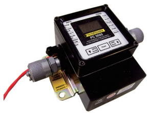
オンライン型 パーティクル カウンター (PC9000)