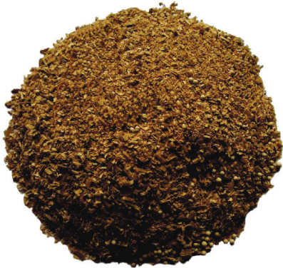
100%天然 セルロース吸着材

エコピュア・セルロース吸着材は2筒並列1パス処理で不純物吸着を行い、1kg当たり500～700LのBDF精製処理が可能です。 (処理量は、原料油・粗BDFの品質により異なります)