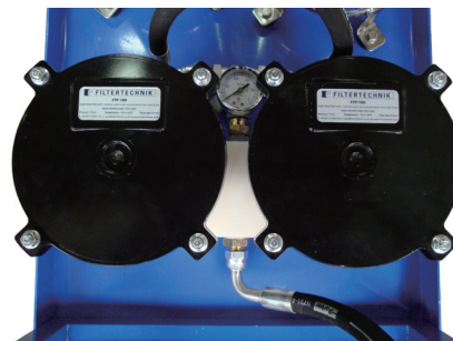
アブソリュート3μm プレフィルター 浄油・吸水