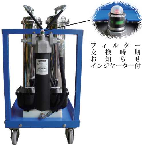
<フロント・ビュー>

上記の他、タワーのサイズ・数の変更や、大量生産向けエコピュア・タワーも取り揃えております。 (尚、在庫品は標準タワー×2筒並列 標準モデルのみ) *精製可能量は粗BDFの品質によって異なります。