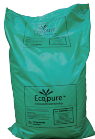
エコピュア 吸着材 <15kg入>