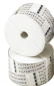
アブソリュート3μm ポリッシャー フィルター <6個入>